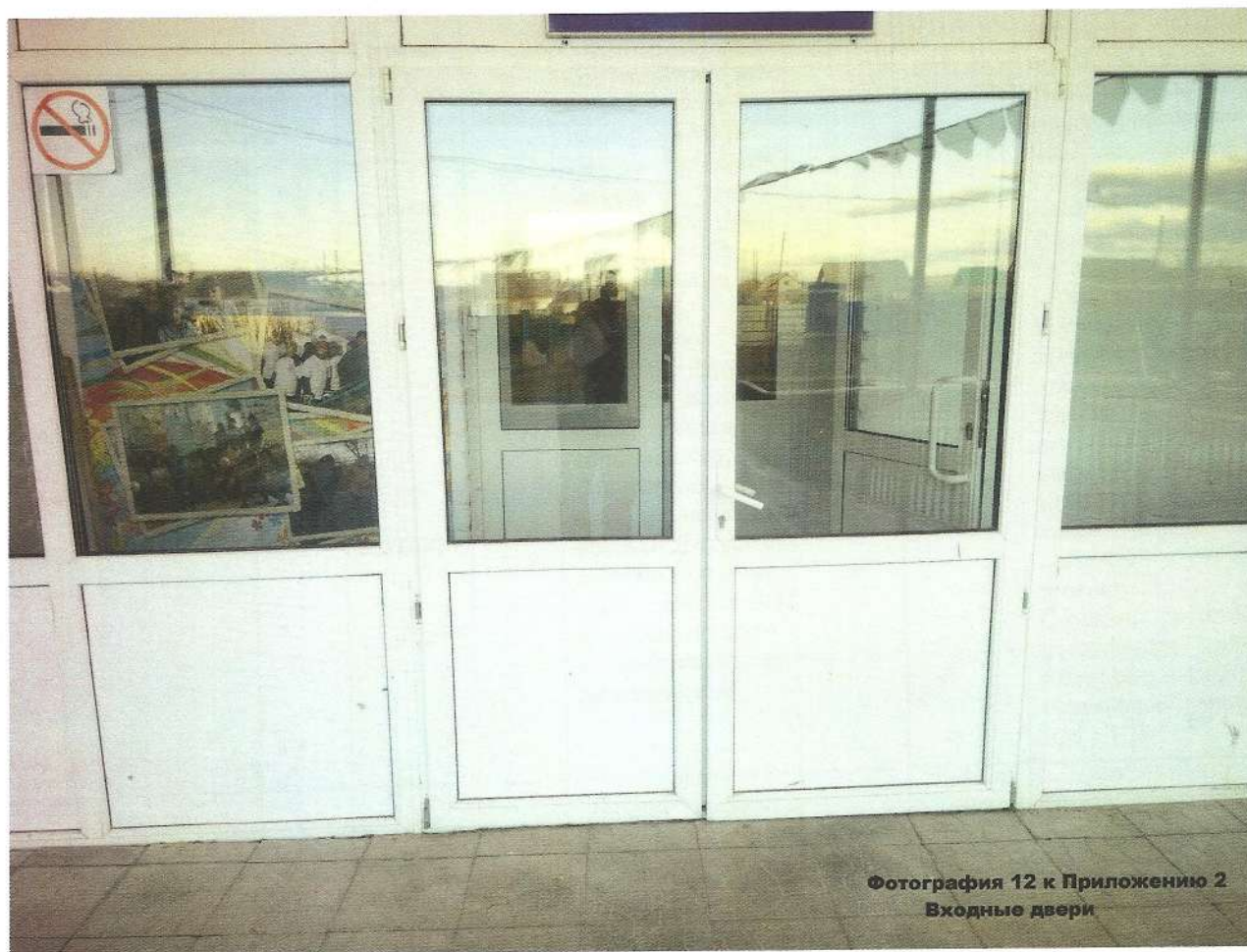
Фотография 12 к Приложению 2 Входные двери