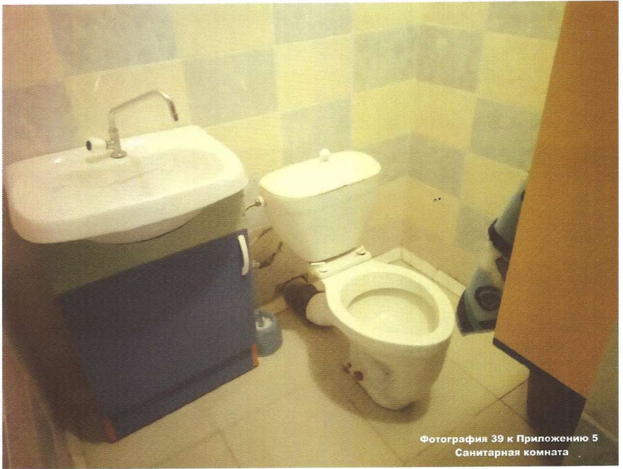
Фотография 39 к Приложению 5 Санитарная комната