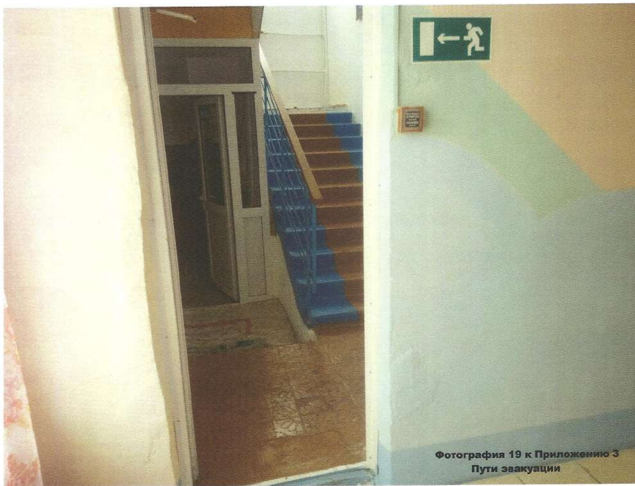
Фотография 19 к Приложению 3 Пути эвакуации