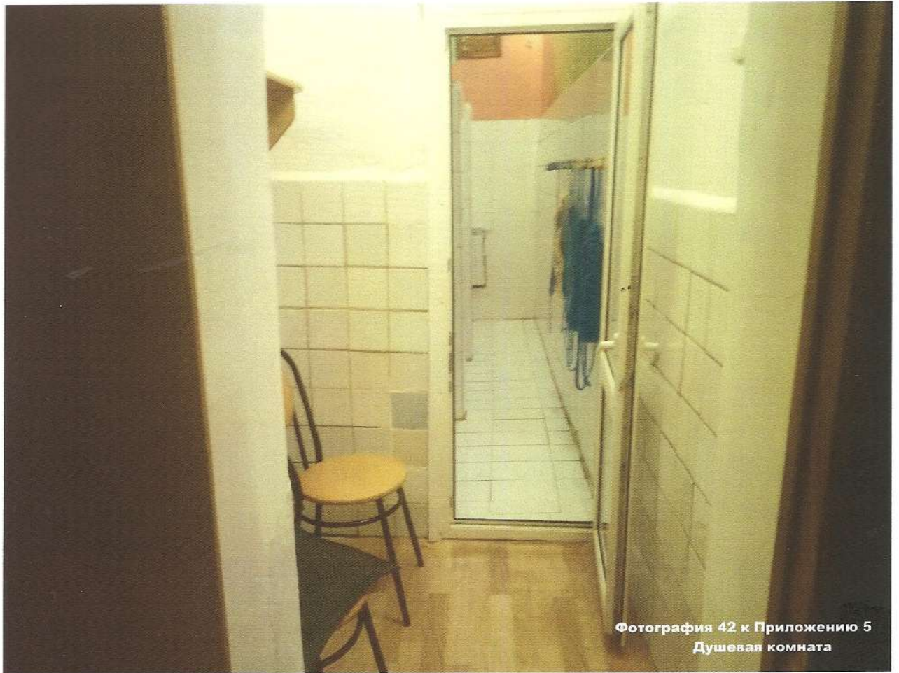
Фотография 42 к Приложению 5 Душевая комната