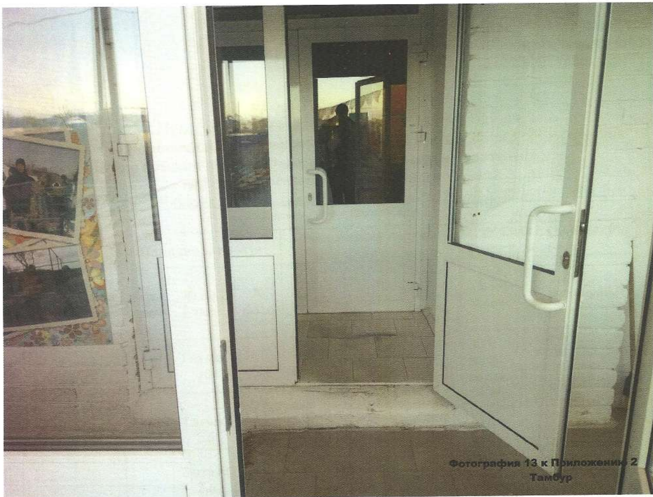
Фотография 13 к Приложению 2 Тамбур