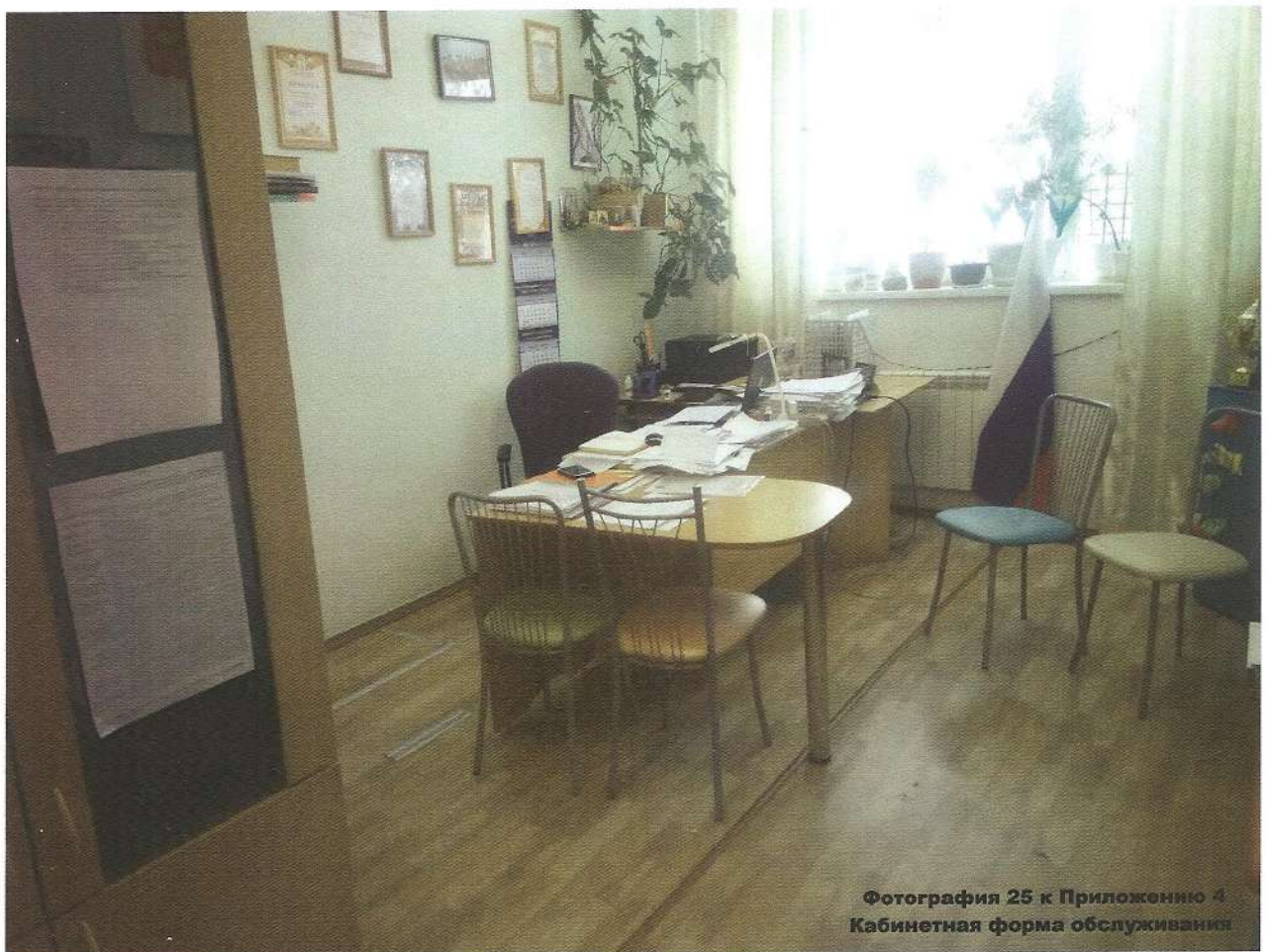
Фотография 25 к Приложению 4 Кабинетная форма обслуживания