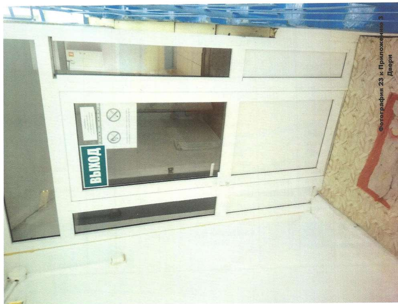
Фотография 23 к Приложению 3 Двери