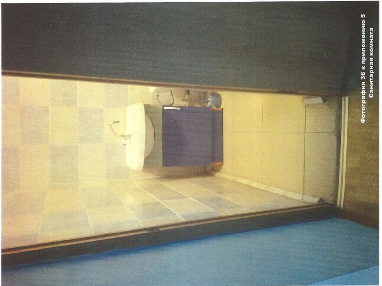
Фотография 36 к приложению 5 Санитарная комната