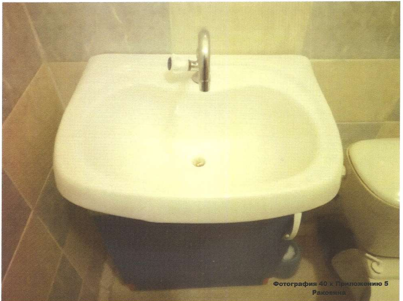
Фотография 40 к Приложению 5 Раковина