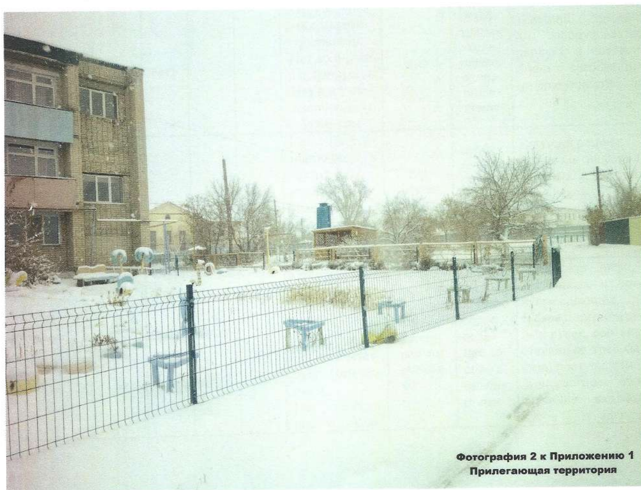
Фотография 2 к Приложению 1 Прилегающая территория