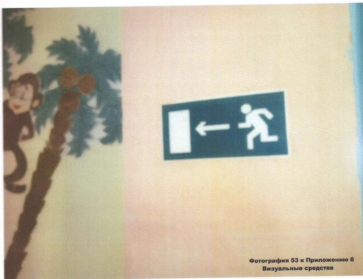
Фотография 53 к Приложению 6 Визуальные средства