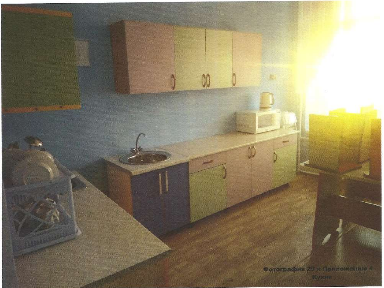
Фотография 29 к Приложению 4 Кухня