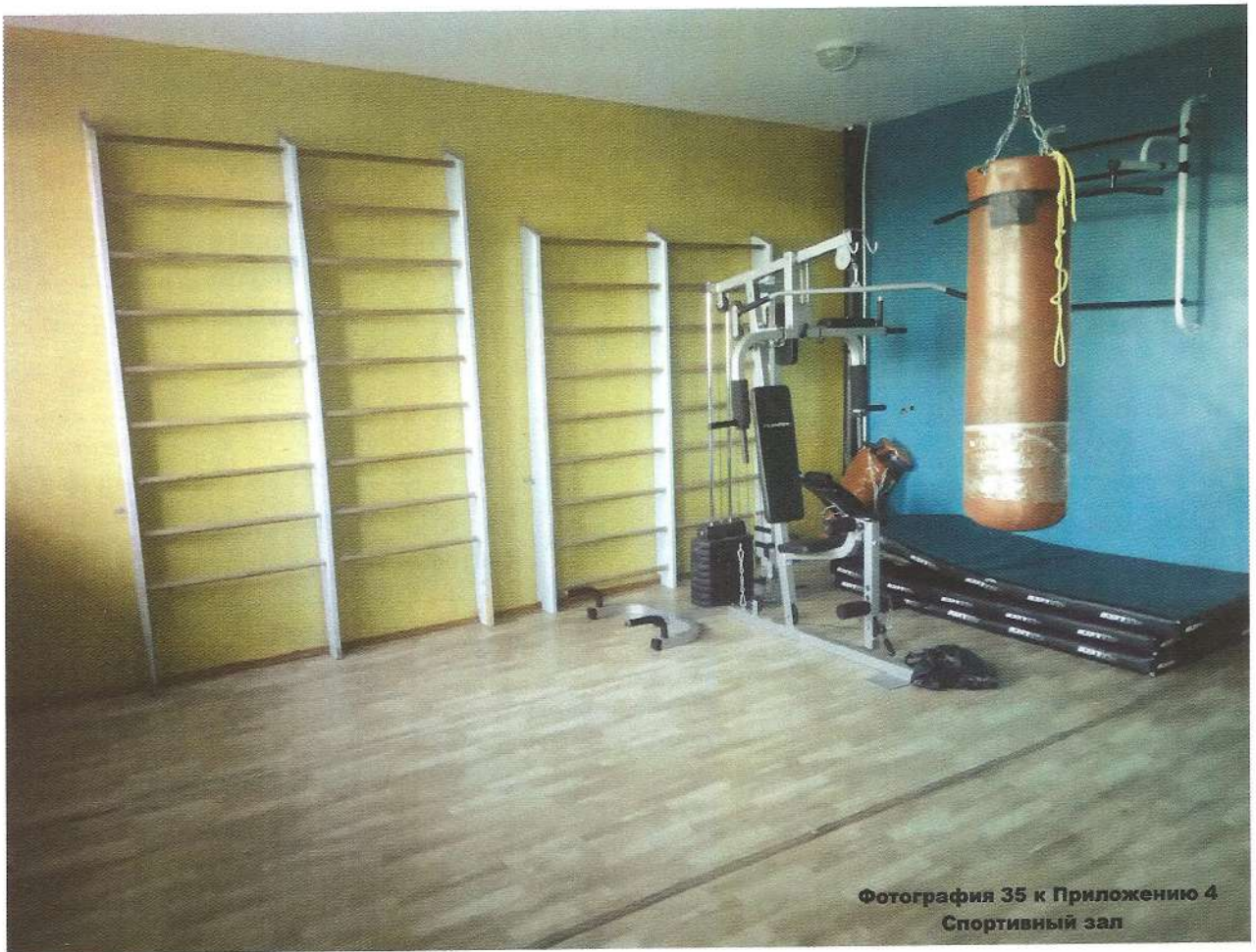
Фотография 35 к Приложению 4 Спортивный зал