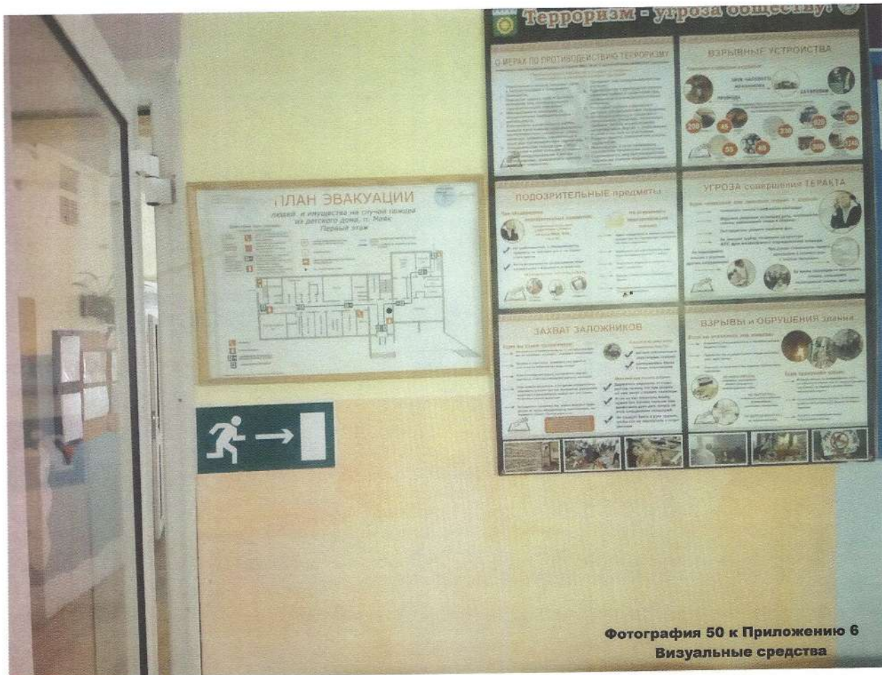
Фотография 50 к Приложению 6 Визуальные средства