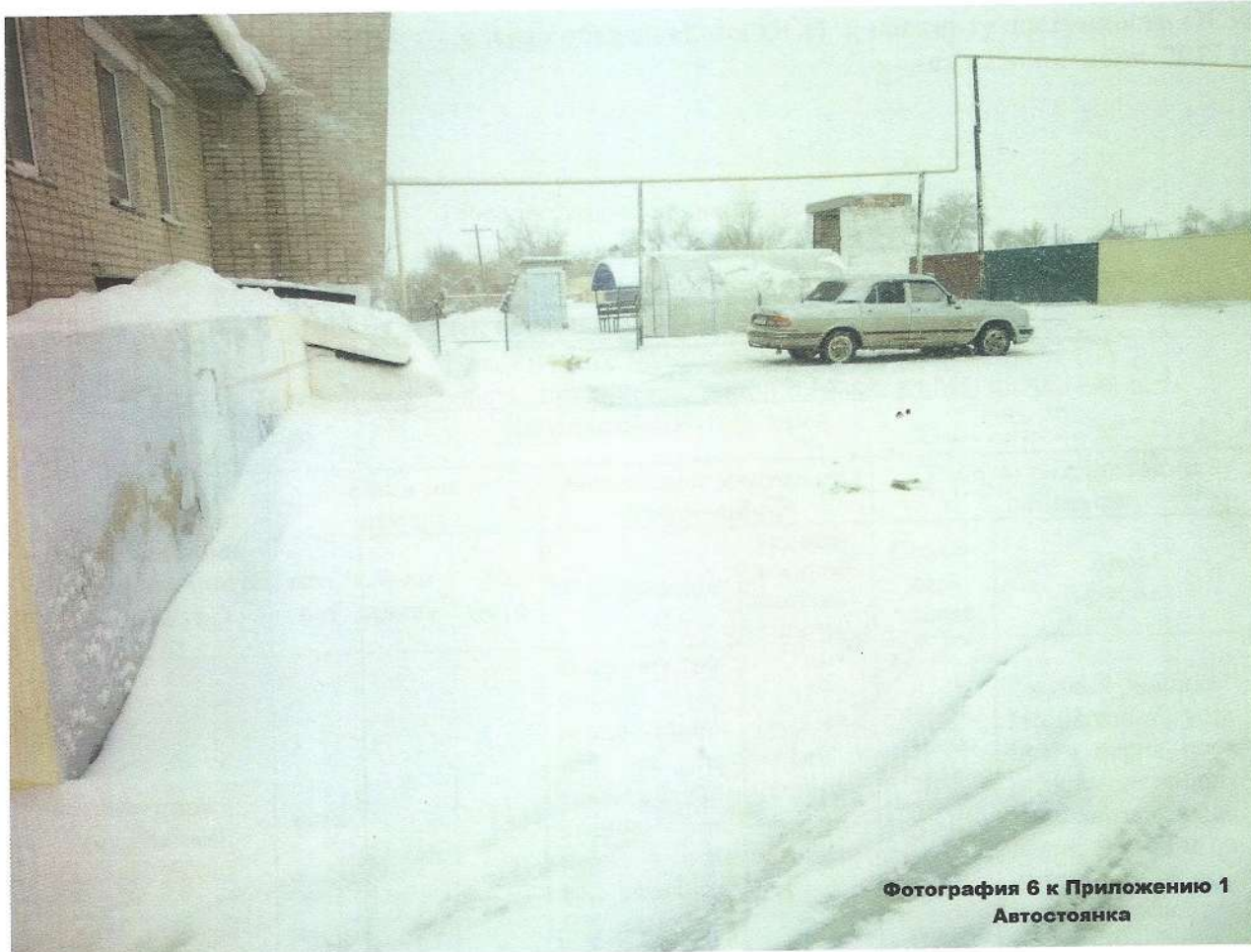
Фотография 6 к Приложению 1 Автостоянка