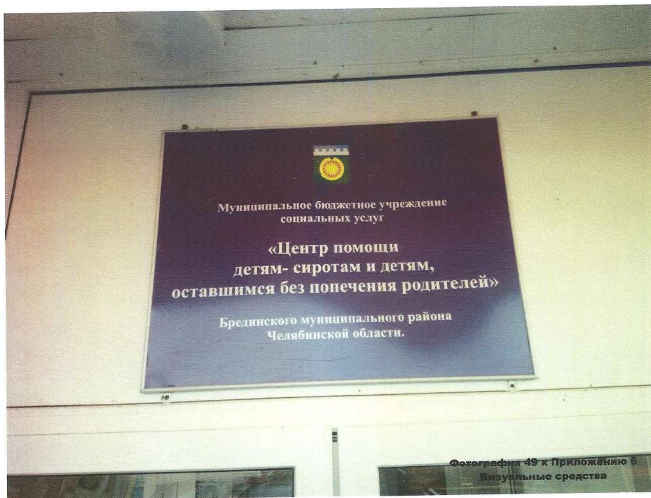
Фотография 49 к Приложению 6 Визуальные средства