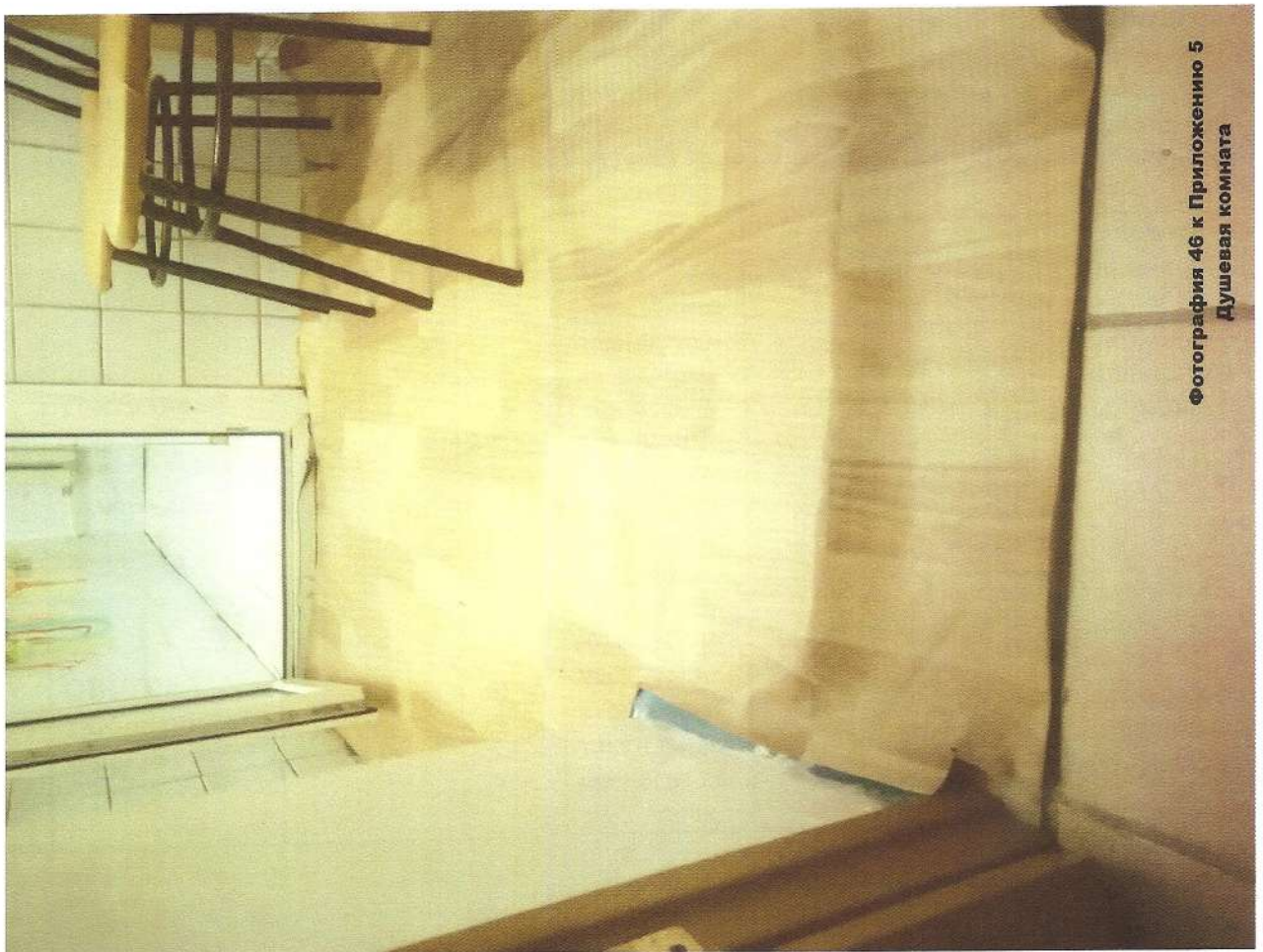
Фотография 46 к Приложению 5 Душевая комната