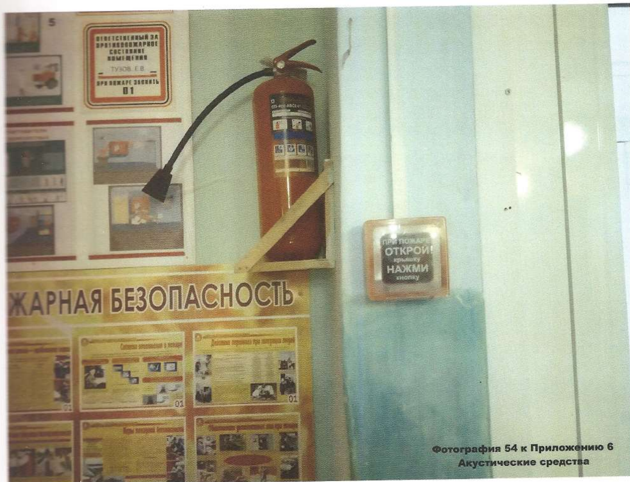
Фотография 54 к Приложению 6 Акустические средства