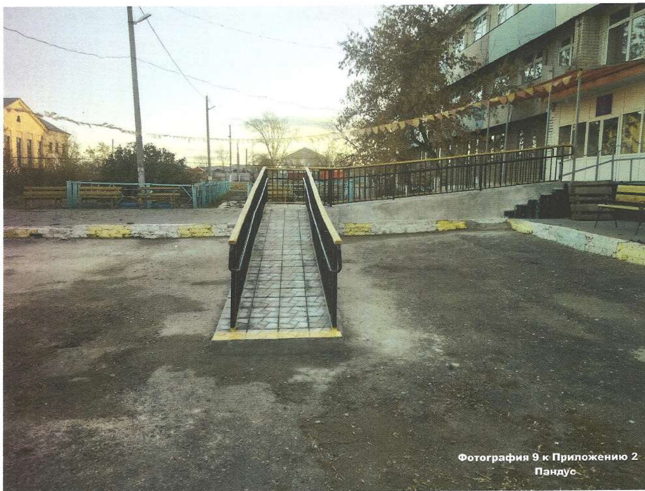
Фотография 9 к Приложению 2 Пандус