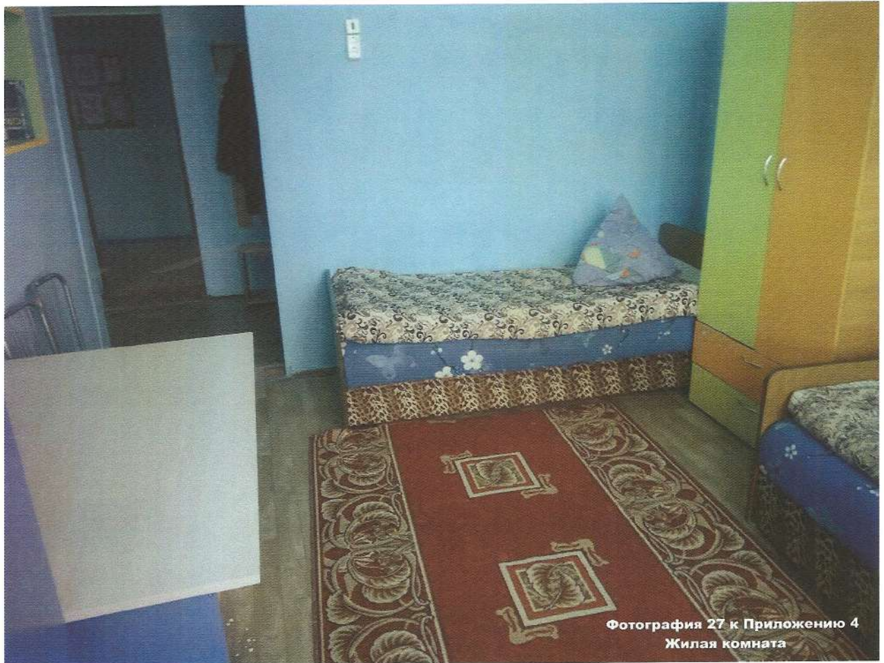
Фотография 27 к Приложению 4 Жилая комната