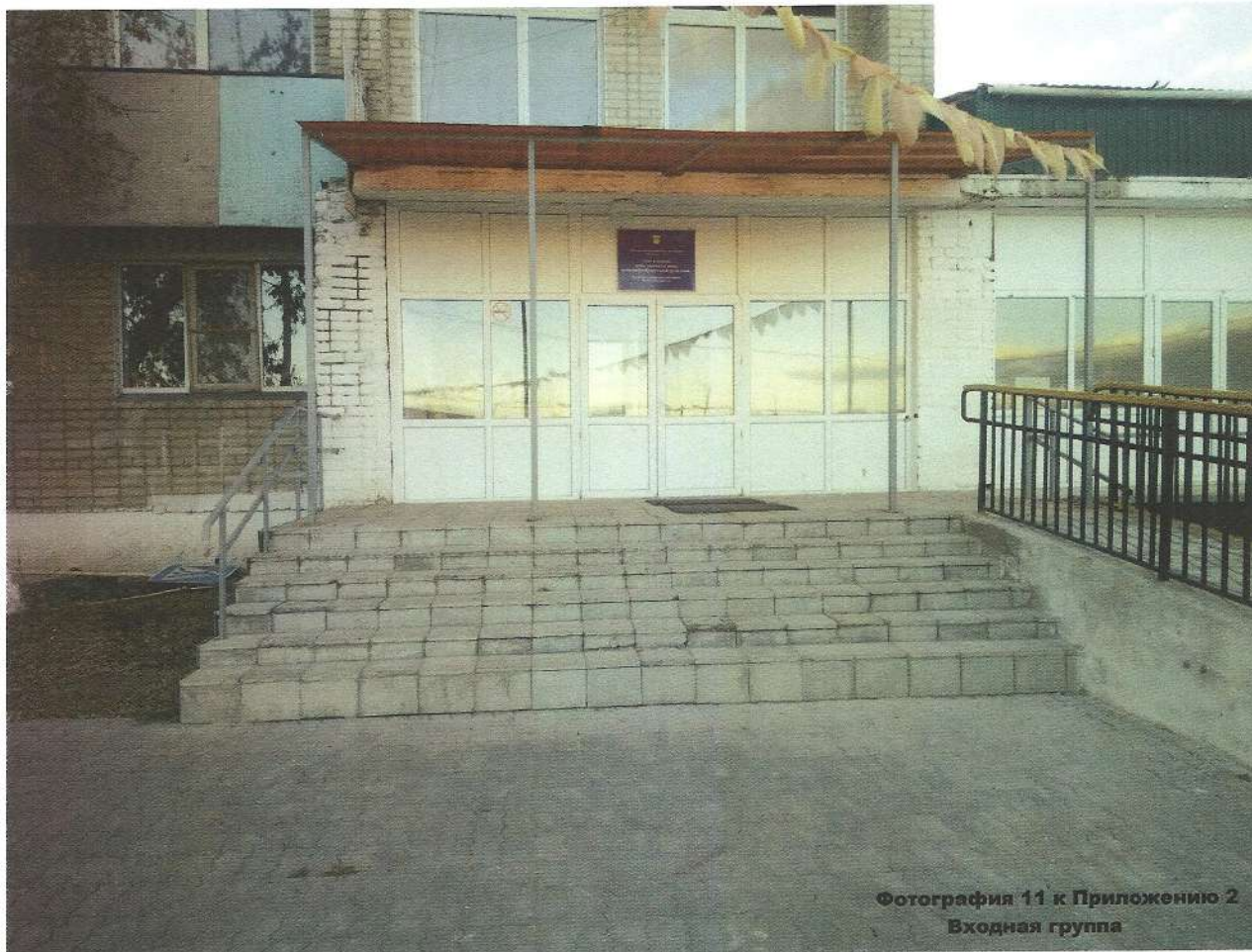
Фотография 11 к Приложению 2 Входная группа